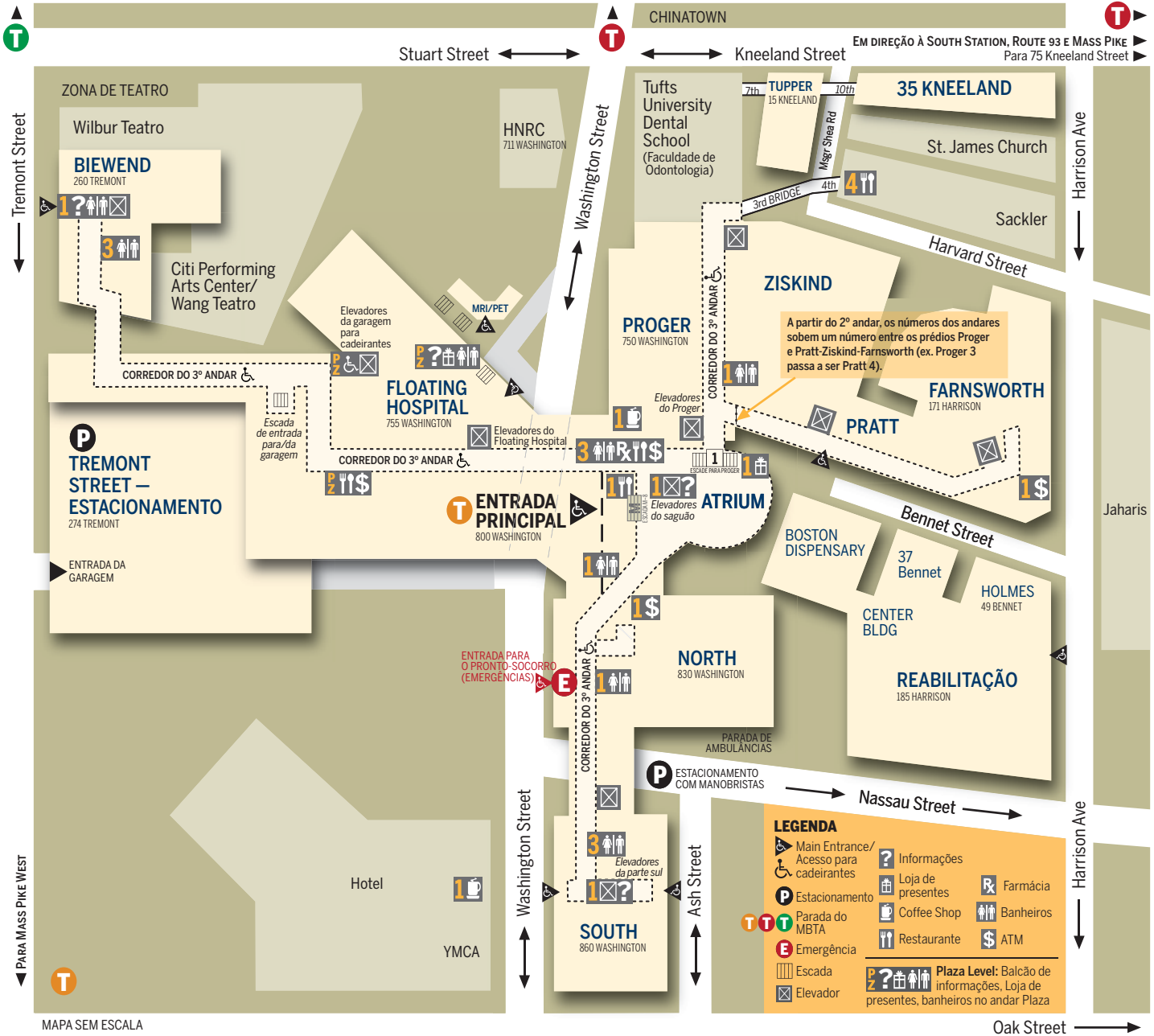
MAPA SEM ESCALA

CONEXÃO PELO CORREDOR DO TERCEIRO ANDAR: É mais fácil chegar a vários pontos do hospital usando o corredor do terceiro andar, que se liga a todos os nossos prédios.